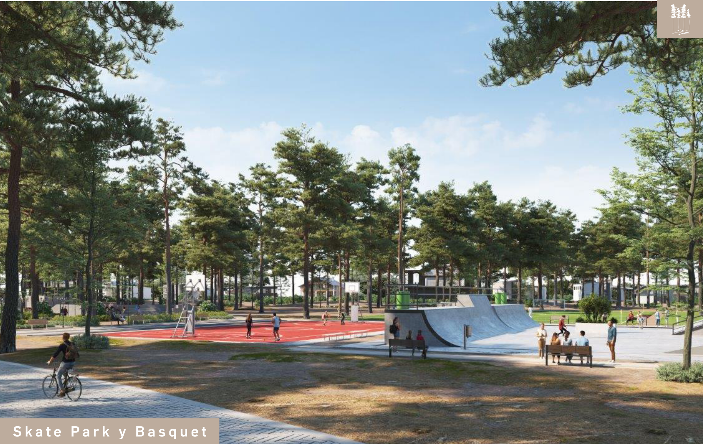
Skate Park y Basquet