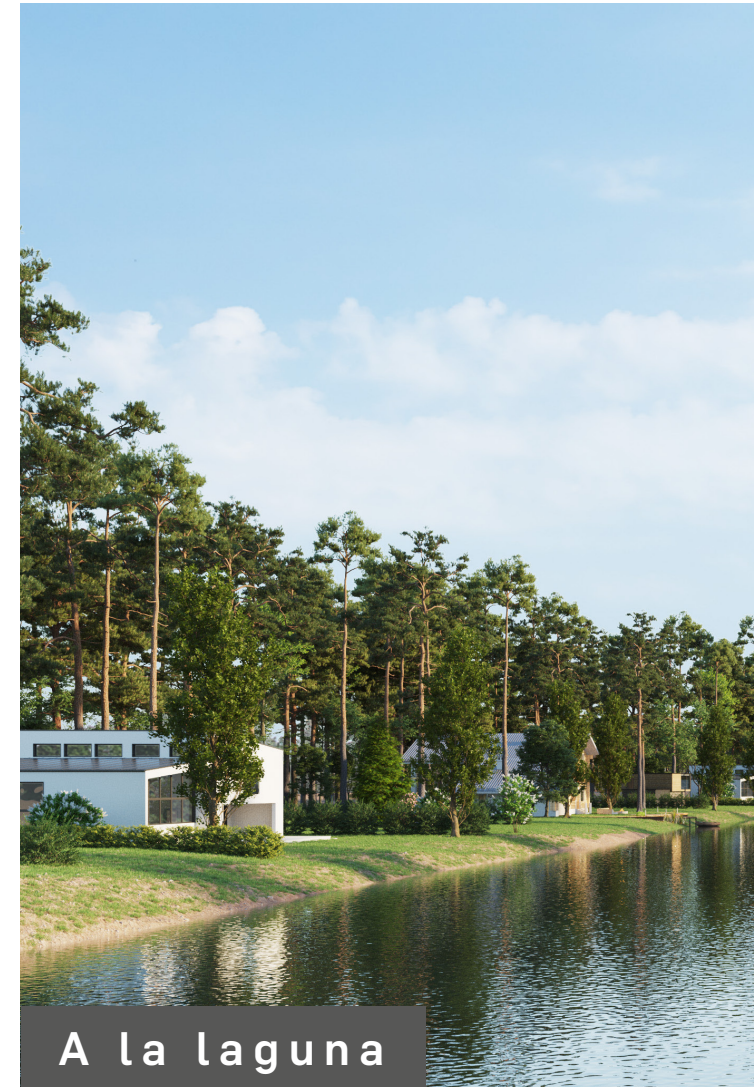
A la laguna